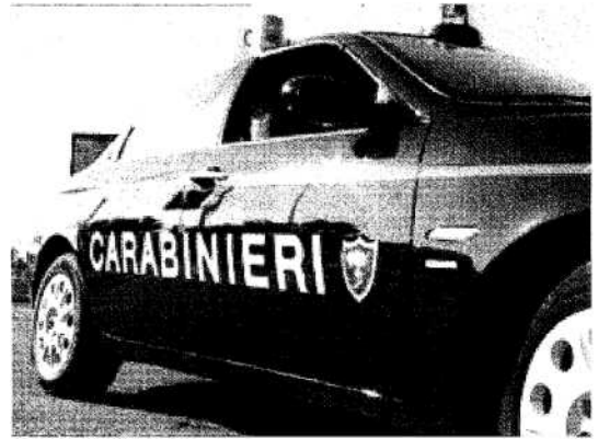
SULL'EPISODIO STANNO INDAGANDO I CARABINIERI DI ALATRI