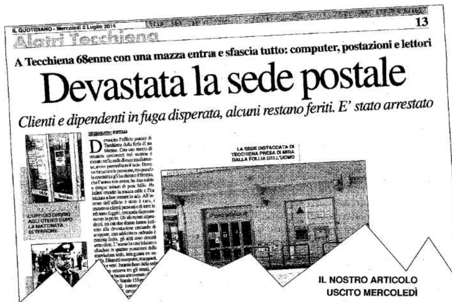
SOPRA, LA SEDE DELL'UFFICIO POSTALE DI TECCHIENA, DI NUOVO AL CENTRO DI UN BRUTTO FATTO DI CRONACA